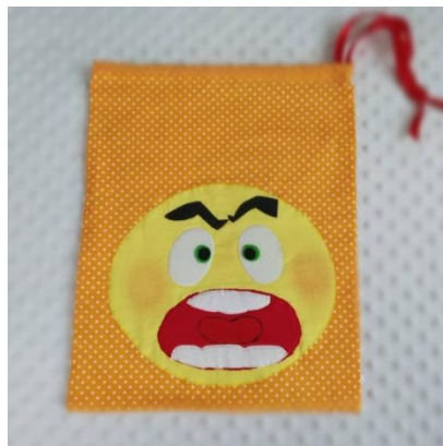
«Мешочек для гнева»